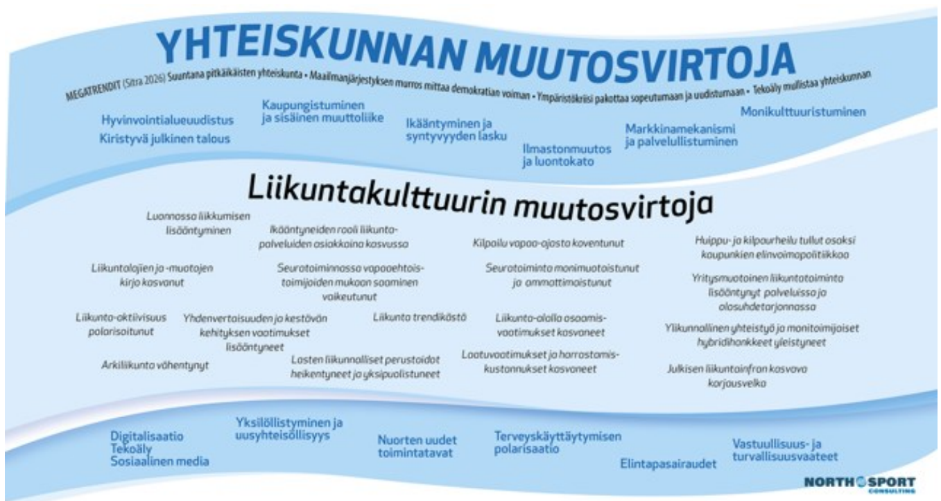
(Kuva 3. Yhteiskunnan muutosvirtoja. North Sport Consulting. 2026.)

Tulevaisuuden toimien suunnittelussa on tärkeää huomioida yhteiskunnassa tapahtuvia muutoksia ja reagoida niihin. Yhteiskunta sekä liikuntakulttuuri kehittyvät ja muuttuvat ajan mukana, joten myös liikuntapalveluiden on pystyttävä muuntautumaan. Ohjelmatyössä tämä onkin huomioitu, ja siinä on pyritty löytämään Ylöjärven kannalta keskeisiä tulevaisuuden haasteita ja mahdollisuuksia, joihin ohjelman aikana vaikutetaan. Tarkastelua on tehty kuvan 3 esittämien yhteiskunnallisten ja liikuntakulttuurin muutosvirtojen avulla. Ylöjärvellä vaikuttavia muutosvirtoja ovat mm. hyvinvointialueuudistus, vapaa-ajasta kilpailun koventuminen, nuorten uudet toimintatavat sekä seuratoiminnassa vapaaehtoisten mukaan saamisen vaikeus.