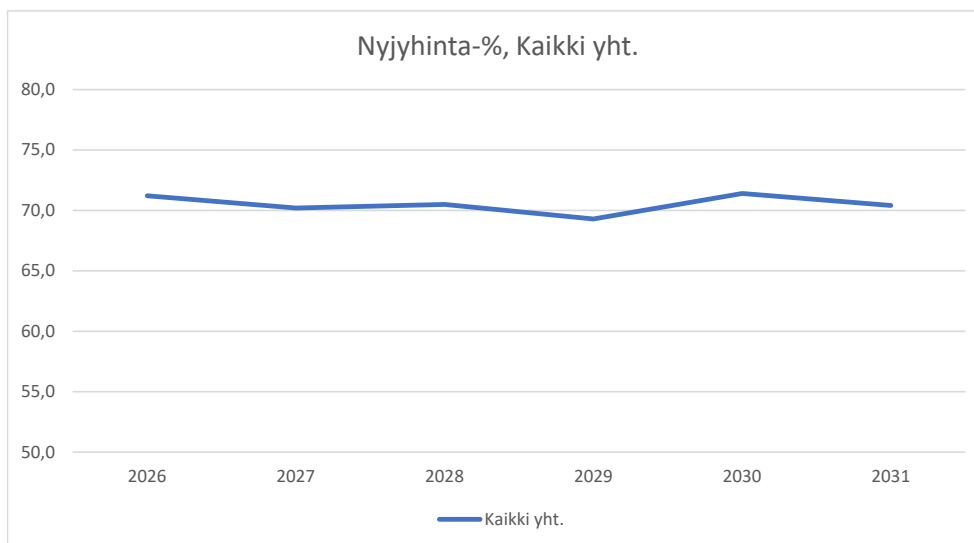
Kuva 1 Rakennusten nykyhintaprocentin muutos vuosina 2026 - 2030

Kuvassa 2 on esitetty nykyhintojen kehittyminen vuosina 2026 - 2030 rakennusten käyttötarkoituksen mukaan jaoteltuna.