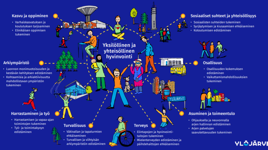
Kuva. Hyvinvoivaa arkea Ylöjärvellä (2024).