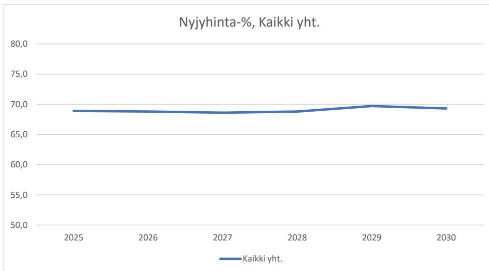
Kuva 1 Rakennusten nykyhintaprocentin muutos vuosina 2025 - 2029

Kuvassa 2 on esitetty nykyhintojen kehittyminen vuosina 2025 - 2029 rakennusten käyttötarkoituksen mukaan jaoteltuna.