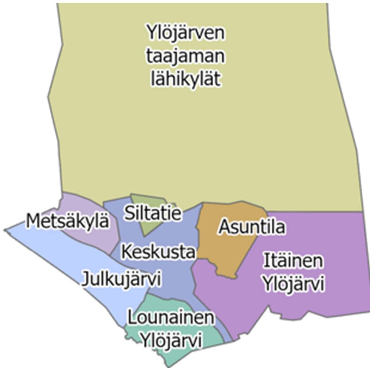
Ylöjärven eteläosan aluejako