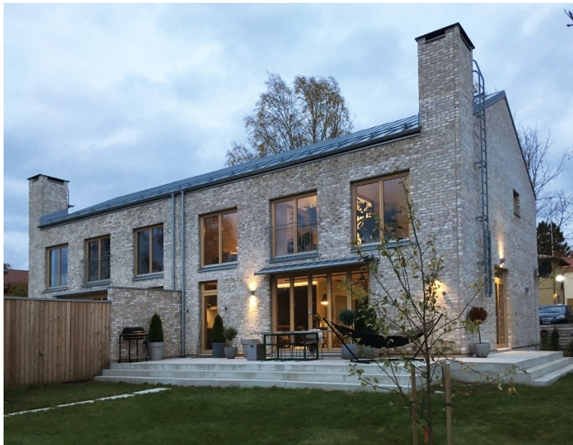
Esimerkki tiilisestä paritalosta, Kannunvalajantie, Helsinki

Rakennusteknisissä ratkaisuissa ja materiaalien käytössä edellytetään kestäviä ratkaisuja ja korkeaa laatua. Rakennuksen julkisivuissa käytettävä materiaali pitää olla joko tiiltä tai puuta. Puuverhoilun tulee olla pystysuuntainen . Tiilen väritys/kuviointi pitää olla eläväpintainen, ei tasavärinen.