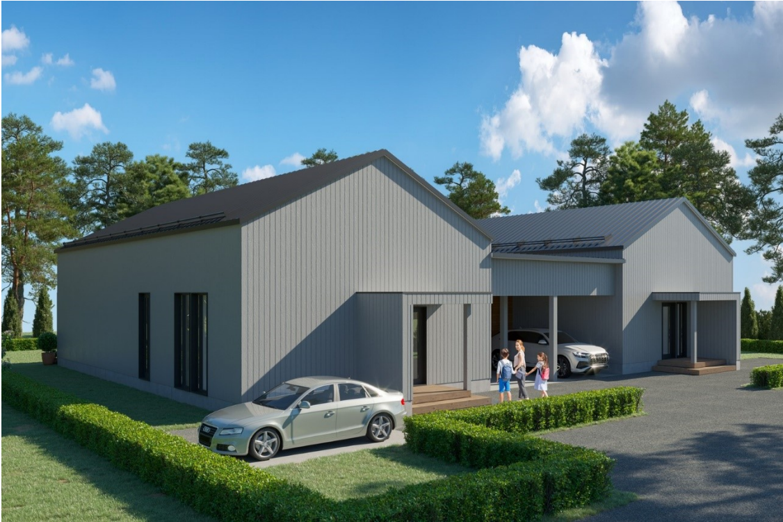
Esimerkki nykyaikaisen näköisestä sisäänkäyntikatoksesta.

Rakennusmassasta ulkonevat katoksien kattojen alapinnat tulee olla vaakasuuntaiset. Katto näyttää edestäpäin katsottuna siis tasakattoiselta. Näin saavutetaan nykyaikainen moderni ulkoasu.