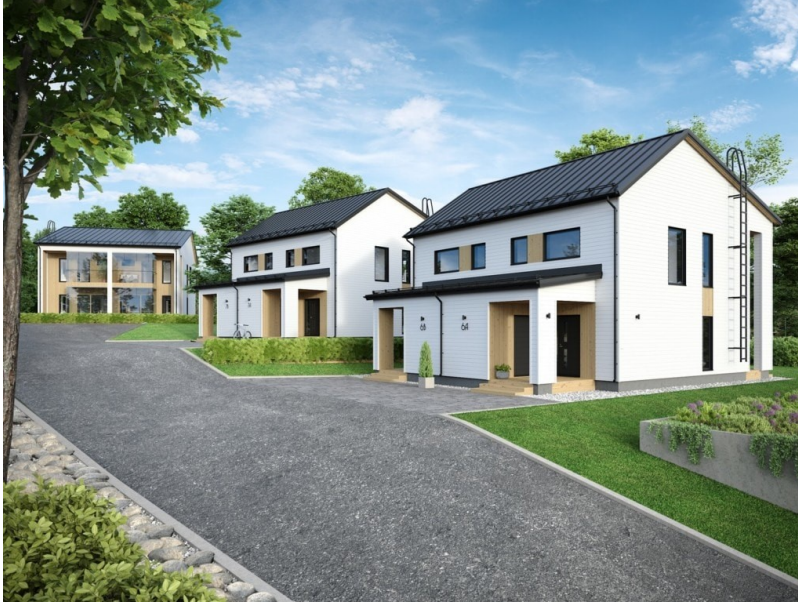
Esimerkkikuva kaupunkimaisista pientalo paritaloista, kuva Kastellin Viva 76