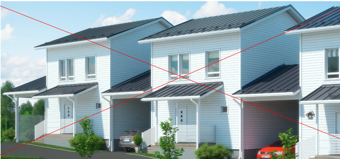
Esimerkki vanhanaikaisesta lippakatoksesta, jollaista ei saa rakentaa.