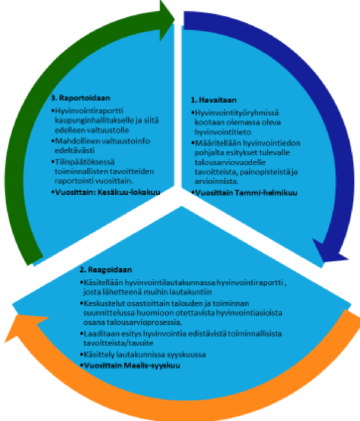
Kuva: Hyvinvointiraportointi talousarvioprosessissa (Saarinen & Liinavuori)