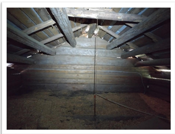
KUVA 3: Päätykolmioista puuttuvat tuuletusaukot, mutta yläpohja vaikuttaa tuulettuvan hyvin, eikä ilma ole ummehtunut.

Yläpohjan tuuletus on kunnossa, eikä ullakkotilassa haise tunkkaiselta. Purut vaikuttavat kuivilta, eivätkä haise ummehtuneelta. Piipun ympärillä purujen alla muovia.