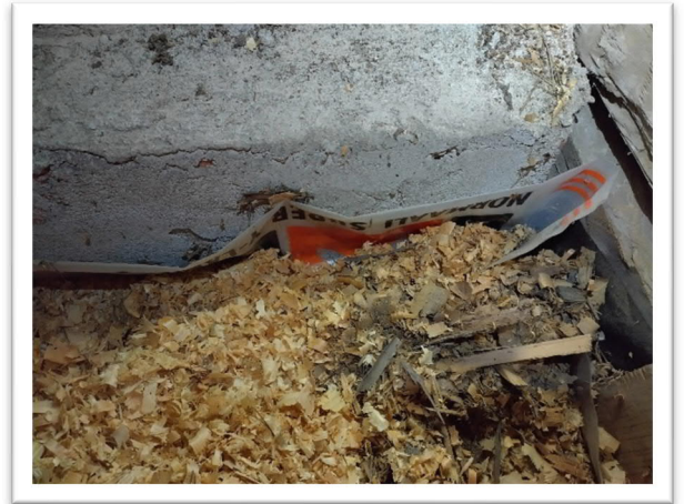
KUVA 4: Yläpohjasta poistetaan muovi

Tuvan alapohja avataan ja varmistetaan, löytyykö sieltä ongelmia. Lattia avataan vähintään piipun ympäristöstä siihen saakka, missä märkiä lattialautoja on havaittu olevan.