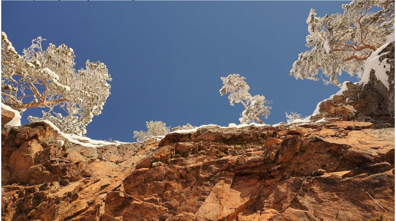
Kallioliippa Koverojärven eteläpäässä Helvetinjärven kansallispuistossa.