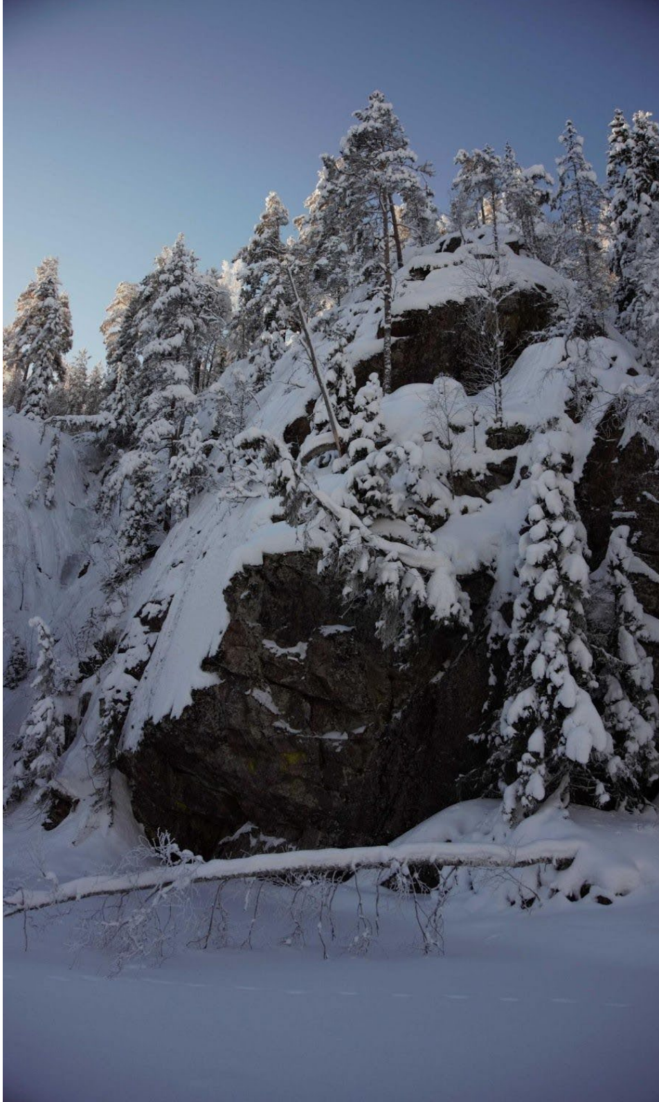
Kallioseinä Pikku-Koverojärven pohjoispäässä Helvetinjärven kansallispuistossa.