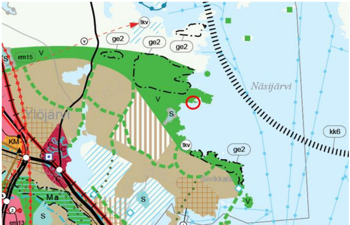
Kuva 3. Ote Pirkanmaan maakuntakaavasta 2040. Suunnittelualueen likimääräinen sijainti on osoitettu punaisella ympyrällä.

Suunnittelualueella ei sijaitse maakuntakaava 2040:n liitteissä esitettyjä pieniä luonnonsuojelualueita, valtakunnallisesti arvokkaita soita eikä alueelle sijoitu maakunnallisesti merkittäviä rakennettua kulttuuriympäristön kohteita.