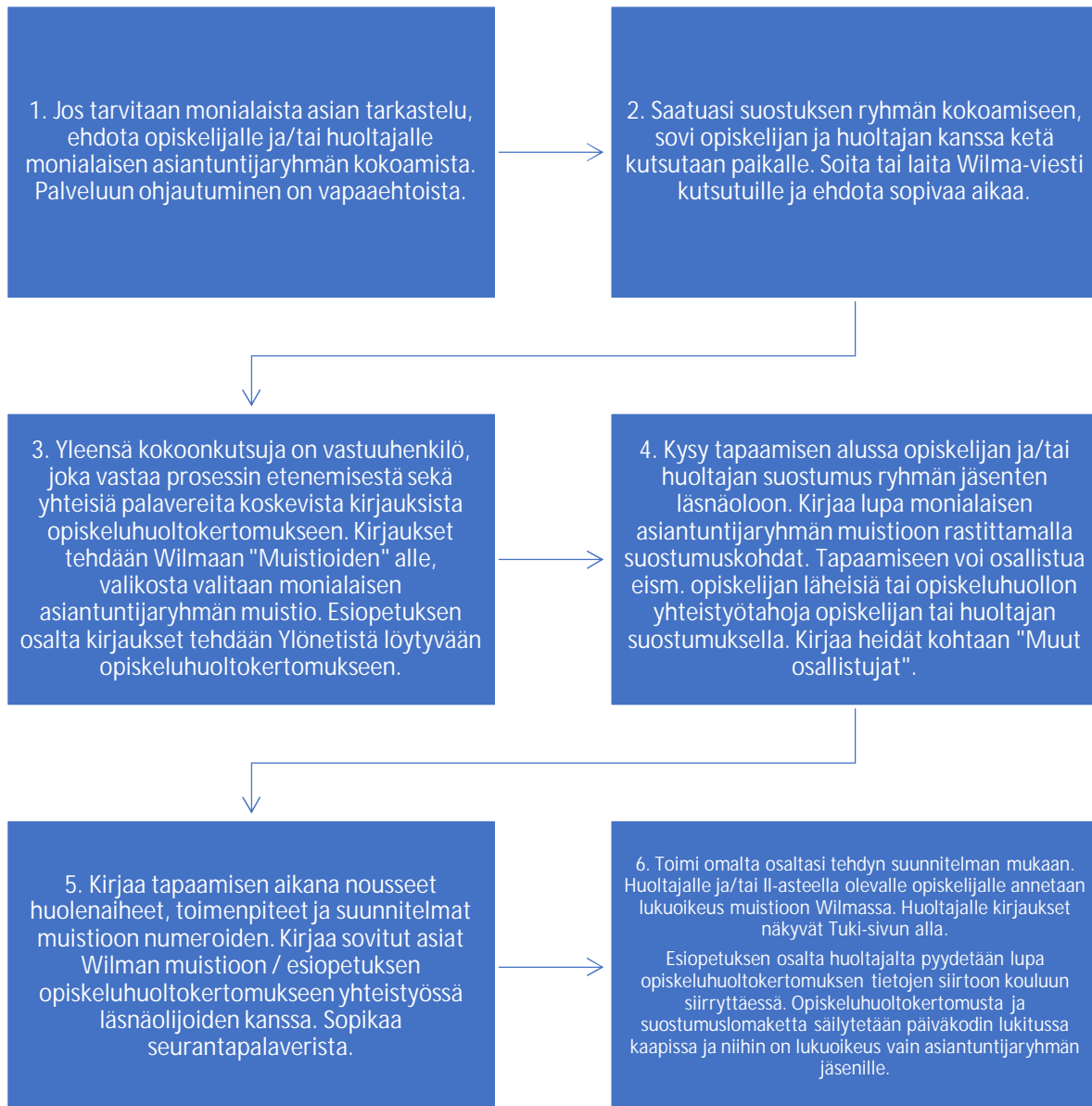
Kaavio 1: Monialaisen asiantuntijaryhmän kokoaminen.

Kaavioon 1 on koottu monialaisen asiantuntijaryhmän kokoamisen toimintavaiheet: