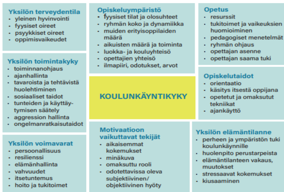
Kuva 1 KOULUNKÄYNTIKYKYYN VAIKUTTAVAT MONET ASIAT

Tärkeä merkitys poissaolo-problematiikan hoidossa on myös ehkäisevillä toimenpiteillä , joita voidaan toteuttaa sekä yhteisö-, luokka- että yksilötasolla .