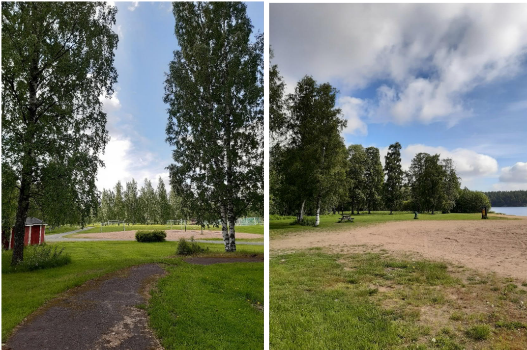
Kuva vasemmalla polkuautoradalta etelän suuntaan. Kuva oikealla uimarantaa pohjoisen suuntaan.

Suunnittelualue tukeutuu vahvasti rakennettuun kaupunkiympäristöön ja on osa keskusta-alueen viheralueverkostoa. Liikennealueille alue tuo vihreää järvimaisemaa, jota voi katsella mm. puiden välistä Kuruntien siltaa ylitettäessä. Aron rannalle saavutaan tällä hetkellä yhdestä suunnasta, pohjoisesta Loilantieltä. Kuruntien alikulkutunneli lisää saavutettavuutta pyöräillen tai kävellen asemaseudun suunnalta. Alueelle ei kuitenkaan ole läpikulkua, mikä itsessään heikentää alueen vetovoimaa. Kaava-alueen pinta-ala on noin 13 ha.