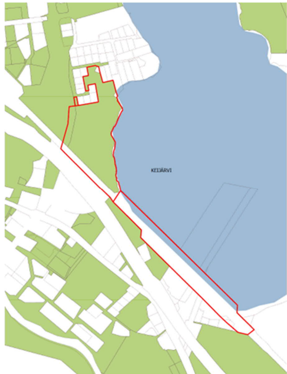
Kartalla vihreällä kaupungin omistama maa-alue.

Keijärven rannan viheralue on kaupungin omistama. Rata-alue, joka kulkee alueen eteläosassa ja jatkuu Keijärven lounaisosaa pitkin Mäkkylään on valtion omistama. Mäkkylän puolella kaava-alueeseen kuuluu myös yksityistä maanomistusta. Kaavatyössä huomioidaan kaksoisraiteen esiselvityksen tilavaraus.