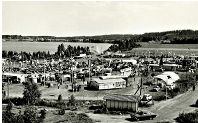
Ote vuoden 1964 maastokartasta ja kuvia alueella järjestetyistä maatalousmarkkinoista 1960-luvulta. (Ylöjärven Seura ry)