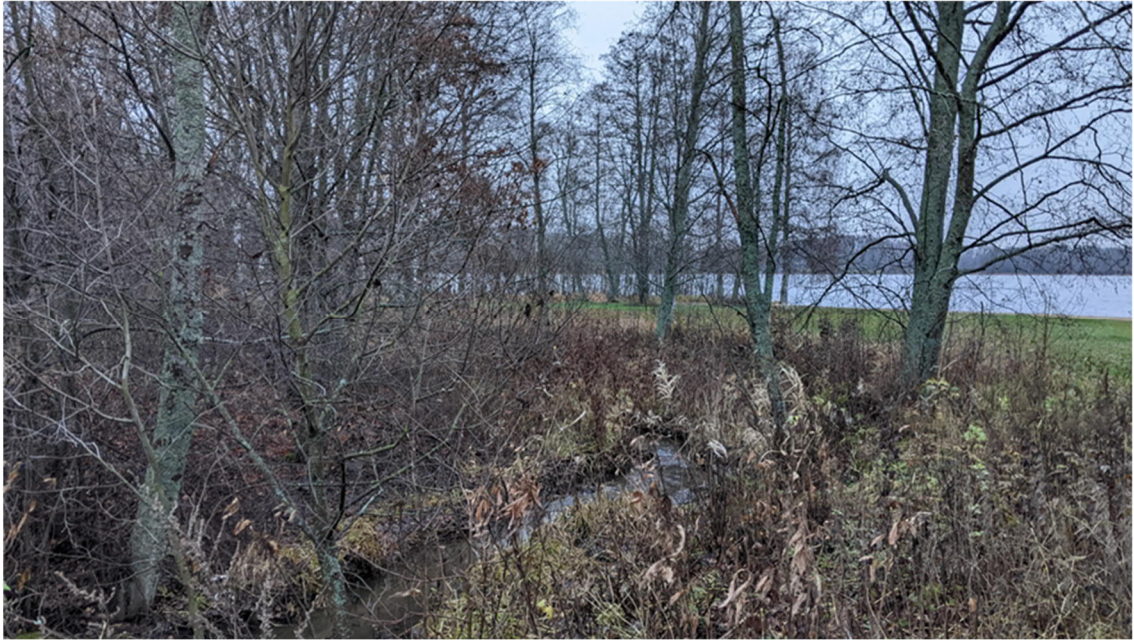
Kuva. Pöyhöja Keijärven rannassa.