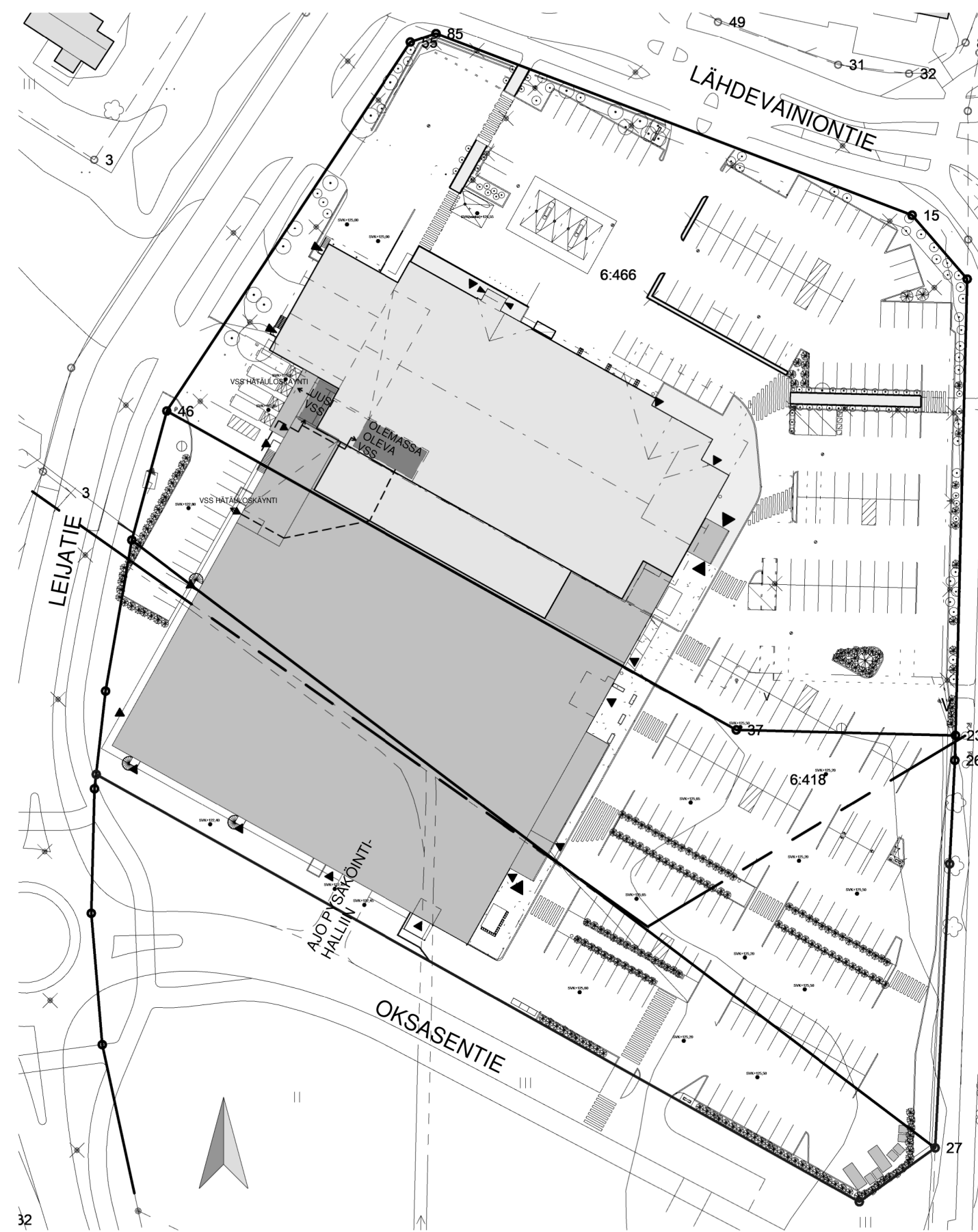
VSS PAIKANNUSKAAVIO 1 : 1000