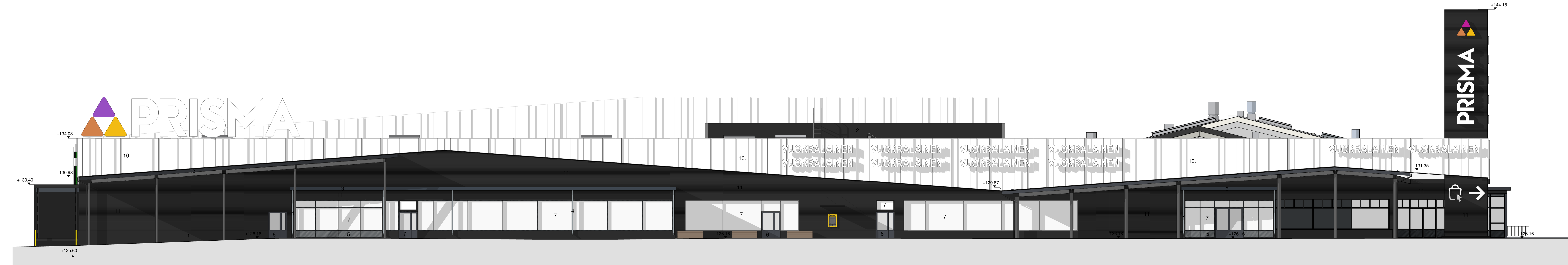
JULKISIVU ITÄÄN 1 : 100