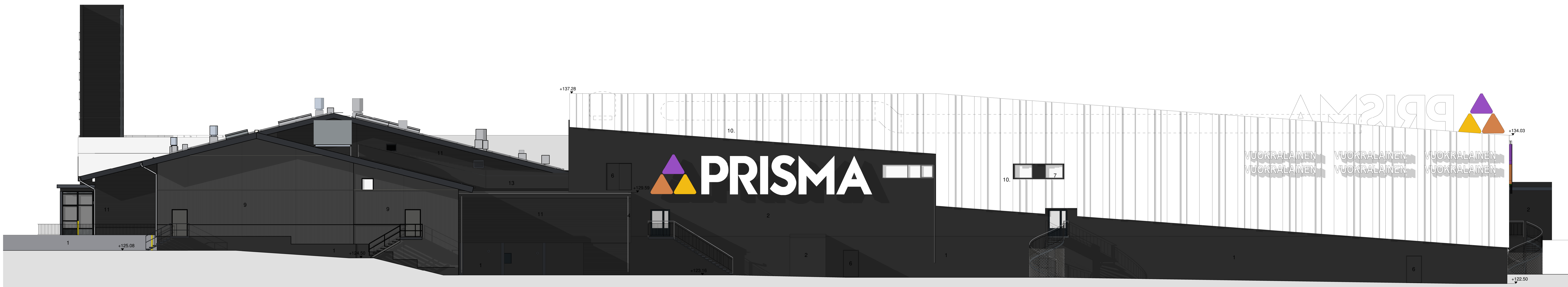
JULKISIVU LÄNTEEN 1 : 100