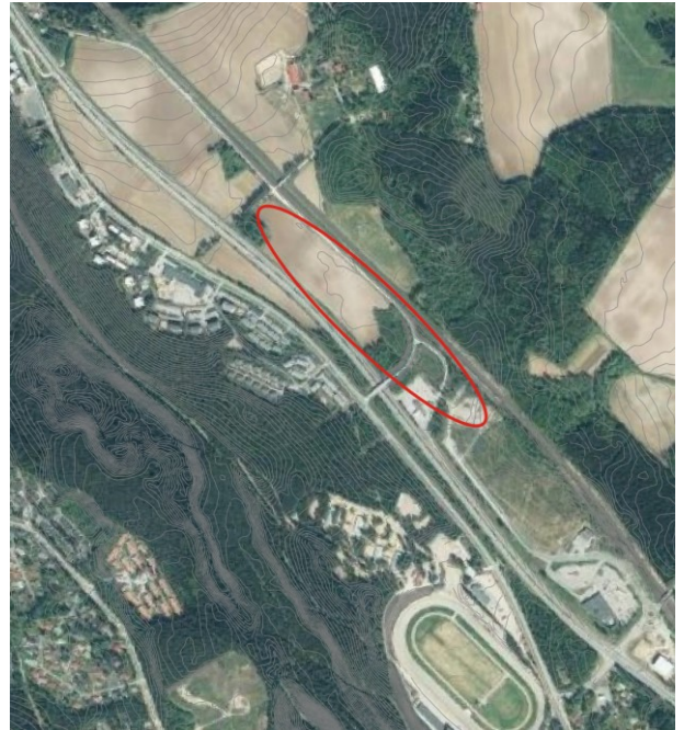
Alueen likimääräinen raja-alue ilmakuvasa

Alue on yleisilmeeltään loivasti luoteeseen viettävää peltoaluetta. Reuna-alueilla on metsäsaarekkeita. Alueen pohjoisreunassa luoteis-kaakkosuuntaisesti kulkeva Keijärventie kääntyy lounaaseen Vaasantien yli, yhdistyen Mikkolantiehen. Eteläreunassa ovat korkeusvaihtelut, pengerryksistä johtuen, suurempia. Suunnittelualue on kaupungin omistuksessa. Aluetta ei ole aikaisemmin asemakaavoitettu.