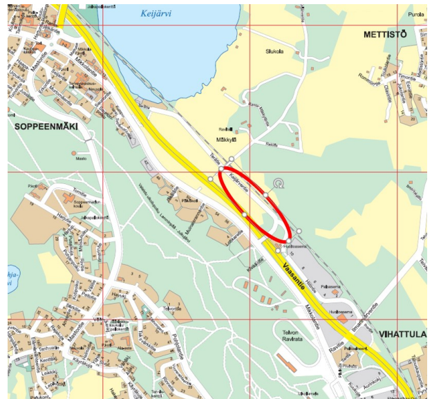
Alueen likimääräinen rajaus opaskartalla

Asemakaava-alue sijaitsee Kirkonseudulla, taajaman eteläpuolella, rajautuen eteläosastaan Vaasantiehen (kantatie 65) ja pohjoisosasta Keijärventiehen ja tien viereiseen Tampere-Seinäjoki pääraataan. Alueen alustava pinta-ala on noin 8,5 hehtaaria. Alue on pääosiltaan rakentamatonta peltoaluetta.