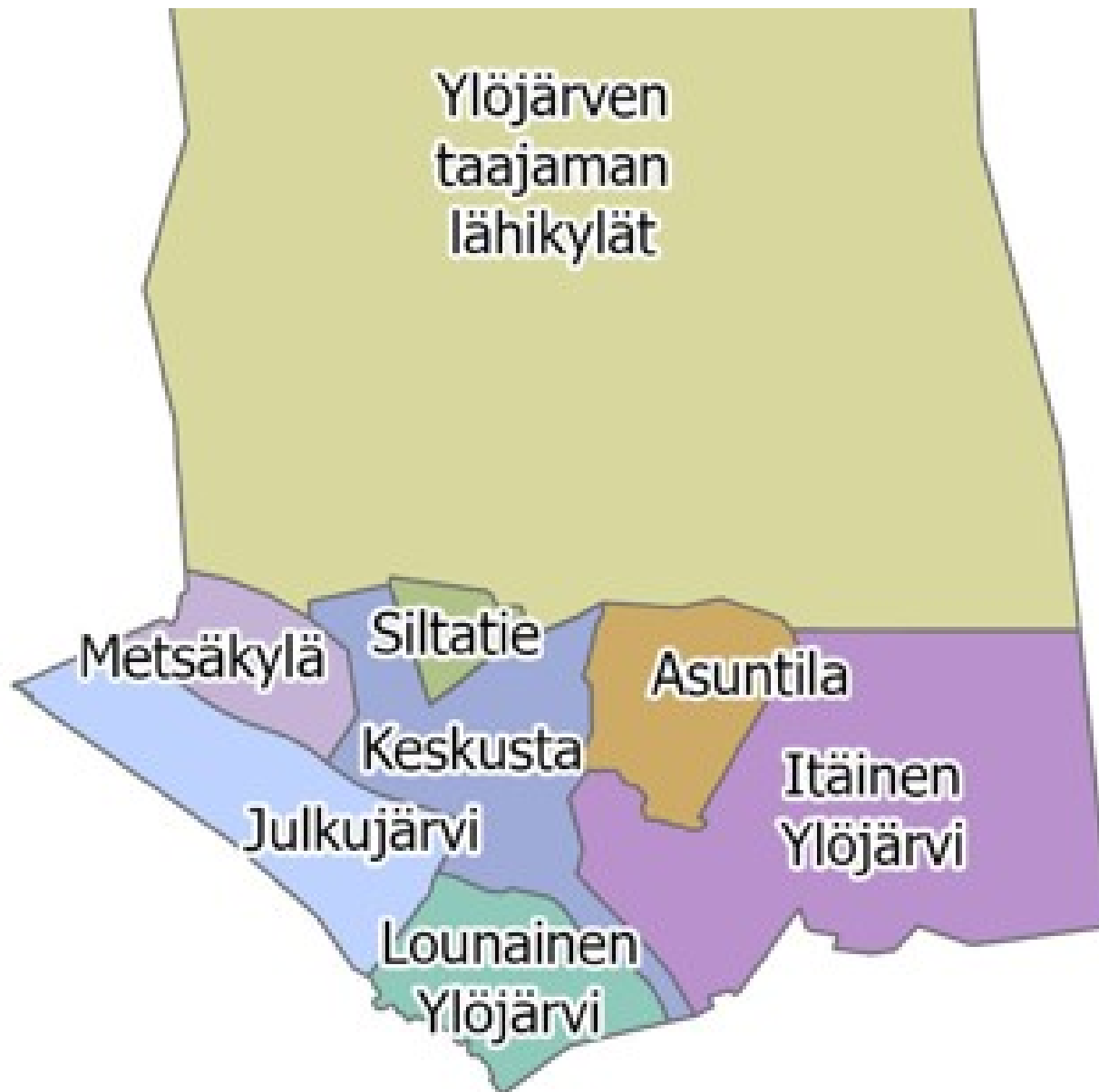
Ylöjärven eteläosan aluejako