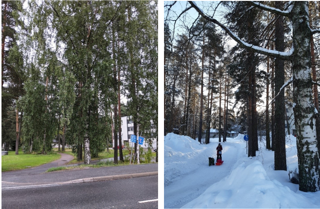
Kuva 3. Säästöpuisto Mastontien ylitse kuvattuna. Puisto tuo vehreyttä kaupunkiympäristöön. Kuva 4. (oikealla) Puistossa säästetään erityisesti mäntyjä, koska ne sopivat harjuympäristön luonteeseen.