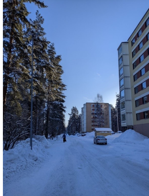
Kuva 5. Seijantien varrella sijaitsee yksittäinen kookas mänty, joka on merkitty kaavassa säilytettäväksi. Puun runko tulee suojata esim. laudoituksella rakentamistyön ajaksi. Kuva 6. Kaavanlaatumishetkellä helmikuussa 2022 asemakaava-alue näyttää Seijantieltä katsottuna puustoiselta.