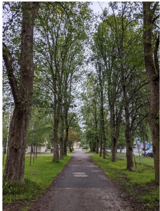
Kuva 7. (ylhäällä vasemmalla) Seijantieltä nykyiselle päiväkodille johtavan tien varrella on koivuja, jotka jouduttaneen poistamaan rakentamisen aikana. Uusi puurivi tulee istuttaa tilalle. Kuva 8. (ylhäällä oikealla) Vihriälän nurmialuetta reunustavat puut jouduttaneen poistamaan pysäköintialuetta rakennettaessa. Kuva 9. (alhaalla vasemmalla) Vihriälän leikki- ja nurmialueen puut näkyvät taka-alalla. Kuva 10. (alhaalla oikealla) Vihriälästä Mikkolantielle johtava puukujanne tulee säilyttää. Puustoa voidaan vaihteittain puu kerrallaan uudistaa siirtämällä mahdollisimman suurikokoisia taimia tilalle.