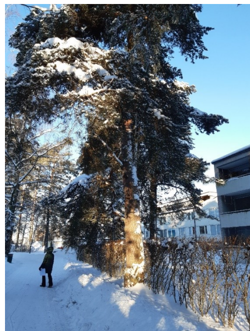
Kuva 1. (vasemmalla) Säästöpuistoon johtava kevyenliikenteen väylä on tärkeä viheryhteys. Koivurivi on kaavakartalla osoitettu merkinnällä Säilytettävä tai istutettava puurivi. Puustoa voidaan uudistaa tarpeen mukaan. Kuva 2. (oikealla) Järeillä männyillä on kauniisti tien yli kaartuva latvusto. Ko. männyt sijaitsevat pääasiassa naapurikiinteistön puolella, mutta olisi toivottavaa, että ne voisivat säilyä alueella kauniina maismaelementtinä.