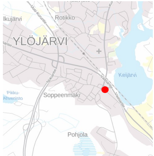
Kuvaan osoitettu punaisella suunnittelualueen sijainti.

Suunnittelualue sijaitsee Ylöjärven kaupungin ydinkeskustassa Soppeenmäen alueella, osoitteessa Seijantie 1. Asemakaavamuutos koskee osaa korttelista 211 ja osaa korttelista 213, lähivirkistysaluetta ja katualuetta.